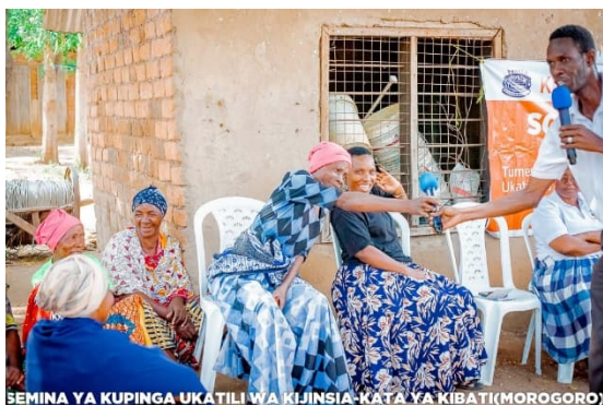
SEMINA YA KUPINGA UKATILI WA KIJINSIA-KATA YA KIBATI(MOROGORO)