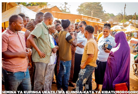
SEMINA YA KUPINGA UKATILI WA KIJINSIA-KATA YA KIBATI(MOROGORO)